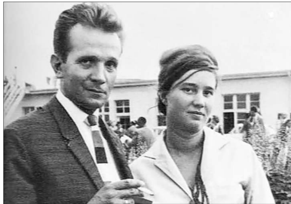
Klaus Rainer Röhl, direttore della rivista Konkret, con la compagna, la terrorista Ulrike Meinhof

sualità dei bambini" da uno a sei anni e assumono la possibilità di rapporti fisici ambigui. Cohn-Bendit si è sempre difeso dicendo che le sue affermazioni erano una "provocazione intollerabile", ma che vanno considerate nel contesto degli anni Settanta ed erano mirate a "scioccare i borghesi". Si trattava del liceo delle élite sessantottine, quello in cui si teorizzava che "insegnare è sbagliato" e che "non c'è differenza tra adulti e bambini". Un istituto nel quale si sono verificati "almeno dal 1971" abusi "che superano la nostra capacità di immaginazione" (parola dell'attuale direttore, Margarita Kaufmann). Il fondatore, Paul Geheeb, decise di abolire il concetto stesso di educazione: "Preferisco non usare le parole 'educazione' e 'educa-