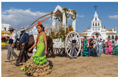
Romería de El Rocío, Huelva