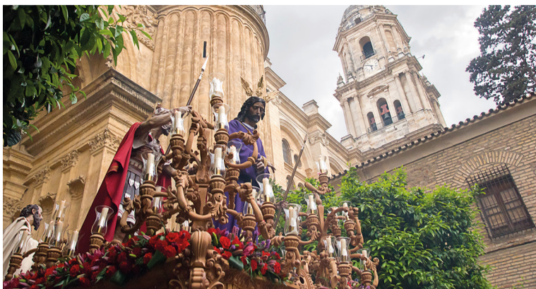
Procesión del Dulce Nombre, Málaga