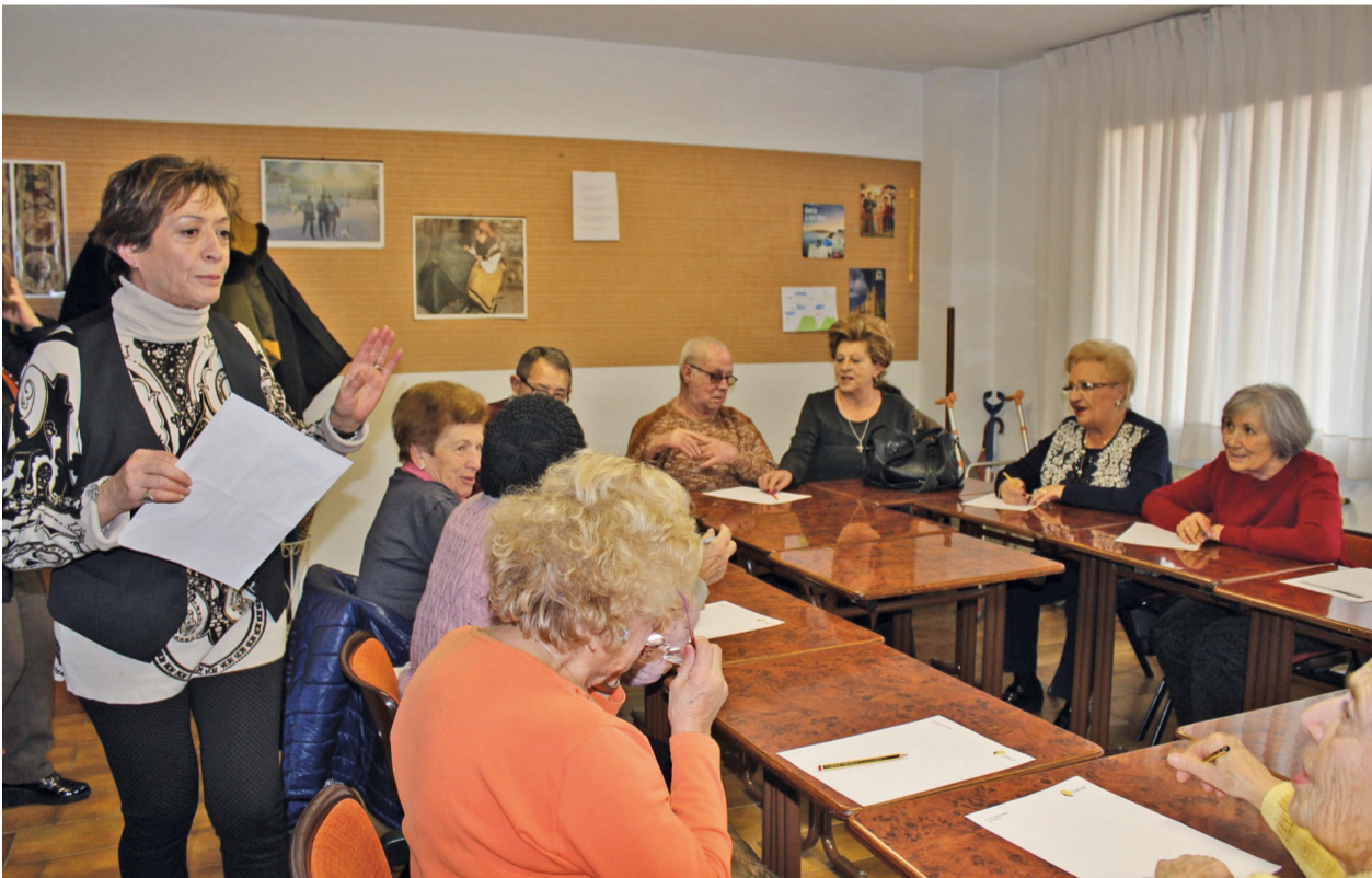
Taller de memoria

“Es un voluntariado muy gratificante porque aunque lo que yo les puedo dar tan solo es un poco de mi tiempo, lo que recibo es mucho más, porque son personas muy cariñosas, que te agradecen todos los días lo que haces con ellas, y eso llena a cualquier persona”.