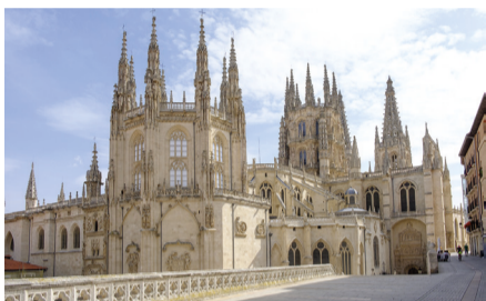
Catedral de Burgos