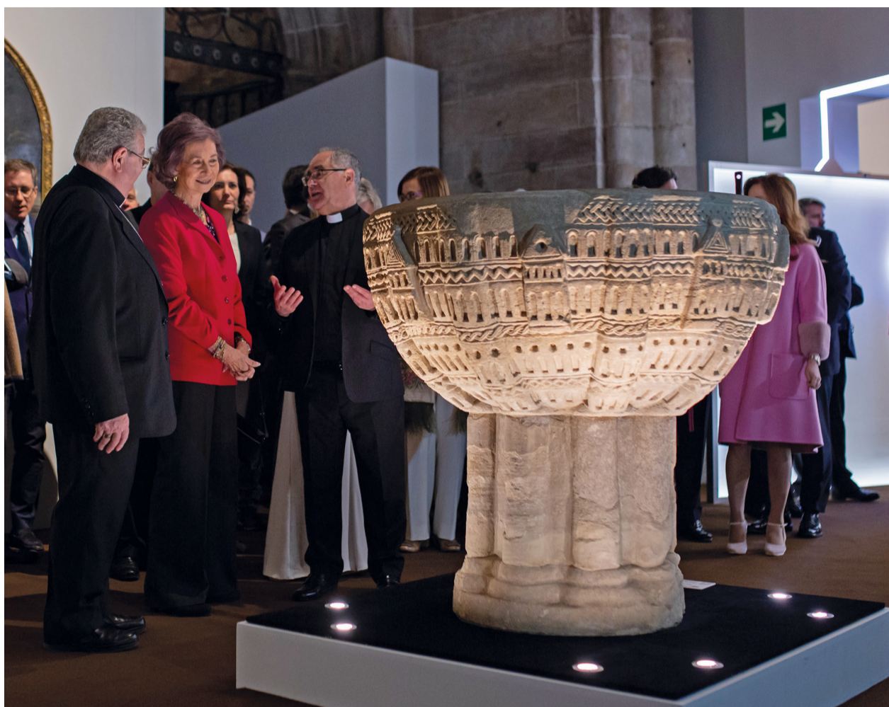
Inauguración de "Mons Dei" con SM Doña Sofía

En el mes de abril se inauguró la XIV edición en la localidad burgalesa de Lerma, que este año está dedicada a la figura de los ángeles.