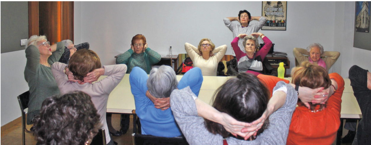
Taller de gimnasia