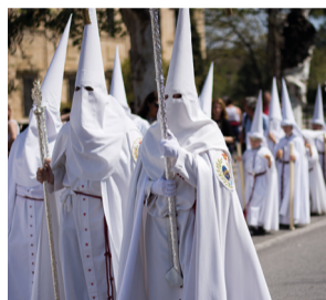
Procesión de Semana Santa