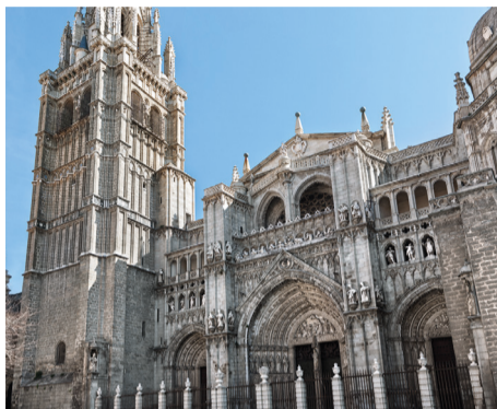
Catedral de Toledo